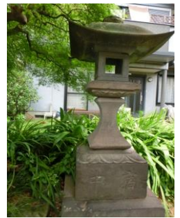
荇田中宿秋葉常夜灯